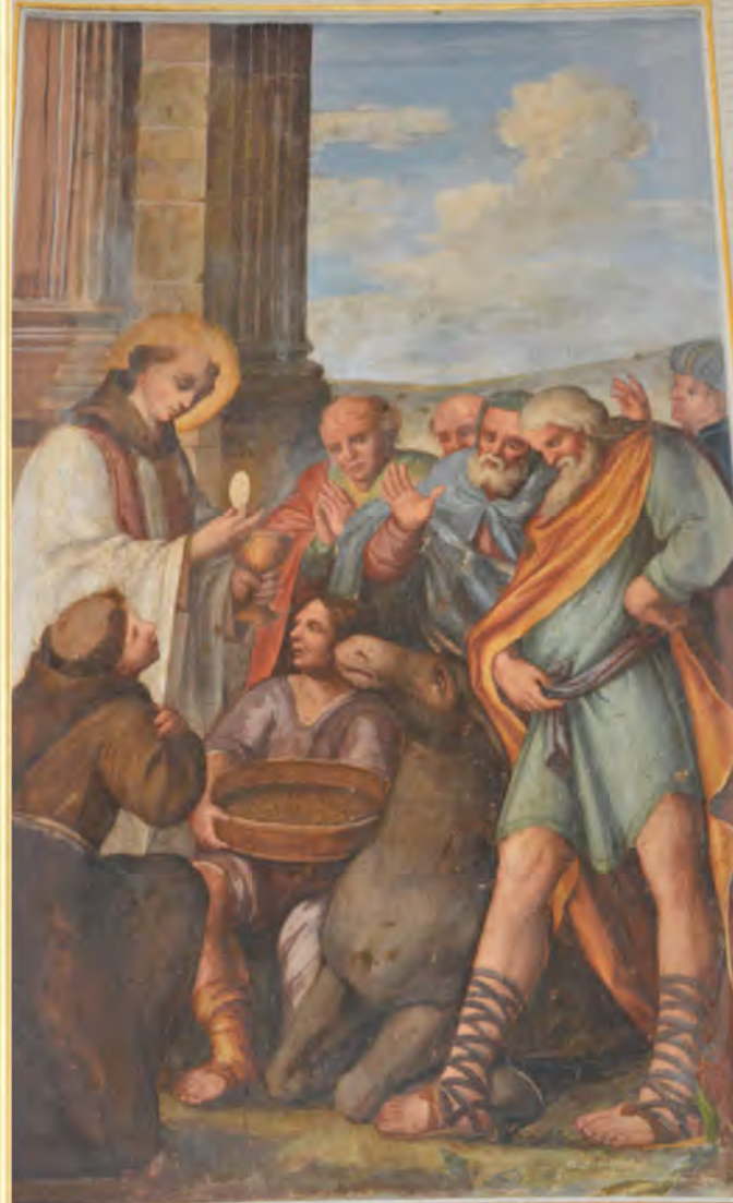
( Chiesa Madre - N.Petralia "S. Antonio da Padova e il miracolo dell'asino" del 1895)