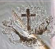
Convento dei Cappuccini