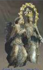
Santuario Maria SS. Annunziata